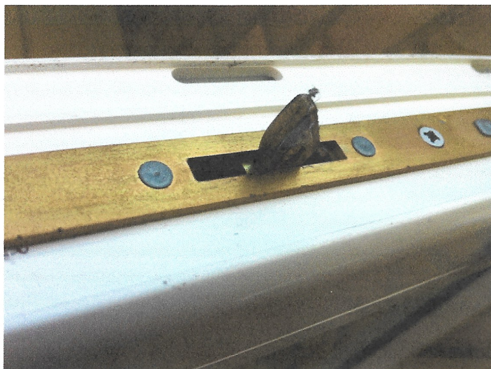
En av fönstertapparna i utfällt - låst - läge

När du vrider om handtaget för att stänga går det i underkanten av fönstret ut två tappar som sedan håller fönstret på plats. Denna mekanism kallas för spanjolett. Spanjoletter finns på öppningsbara fönster och på din balkongdörr.