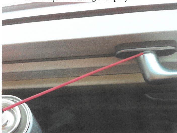
Smörj handtaget här